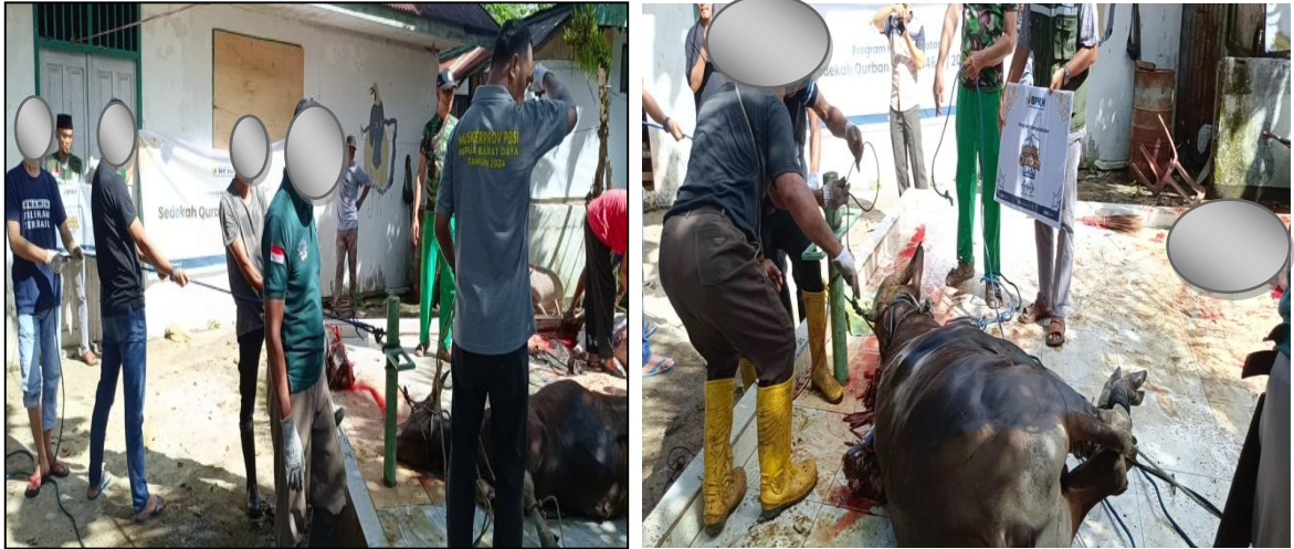
Gambar 3: Dokumentasi Penyembelihan Hewan Qurban