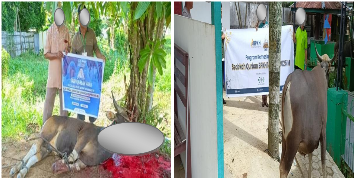
Gambar 2: Dokumentasi Penyembelihan Hewan Qurban

Sedangkan qurban dari Kemendikdasmen RI dalam bentuk dana ke rekening LAZISNU dan dana tersebut langsung di serahkan kepada Pimpinan Wilayah Muhammadiyah Papua Barat Daya untuk membeli hewan qurban serta didistribusikan kepada guru-guru persyarikatan Muhamamdiyah dan masyarakat umum yang berhak menerimanya. Pembelian dan pemelihan hewan qurban Pimpinan Wilayah Muhammadiyah Papua Barat Daya berkoordinasi dengan LAZISNU Kota Sorong sesuai dengan harga yang telah ditetapkan, dalam hal ini, pemilihan hewan qurban dilakukan dengan ketat, dengan memastikan bahwa hewan yang dibeli memenuhi syarat-syarat untuk ibadah qurban (Musliyana et al. 2022).