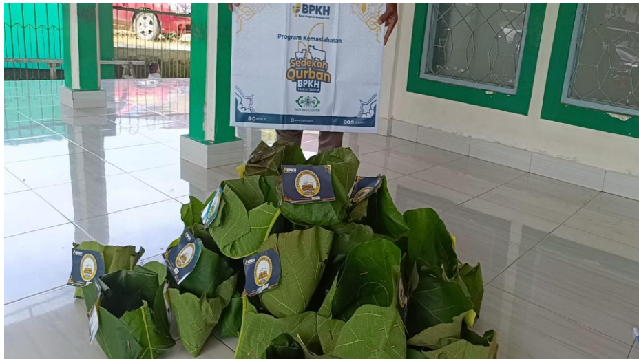
Gambar 4: Bungkusannya Daging Qurban 1446 H/2025

Setelah proses penyembelihan hewan qurban selesai, tahap berikutnya adalah pengolahan dan distribusi daging qurban. Proses ini dilakukan dengan tujuan untuk memastikan daging qurban dapat sampai ke tangan mereka yang berhak, terutama masyarakat yang membutuhkan (Wibowo, 2020). Perose pengelolaan daging qurban yang dilakukan oleh LAZISMU Kota Sorong sesuai arahan dari BPKH dan Kemendikdasmen RI yang mana mempertimbangkan aspek hemat lingkungan terutama limbah plastik tidak boleh digunakan untuk membungkus daging qurban, sehingga LAZISMU Kota Sorong menginisiasi dengan menggunakan daun jati sebagai bungkusannya hewan qurban unruk mendistribusikanya sebagaimana gambar berikut ini.