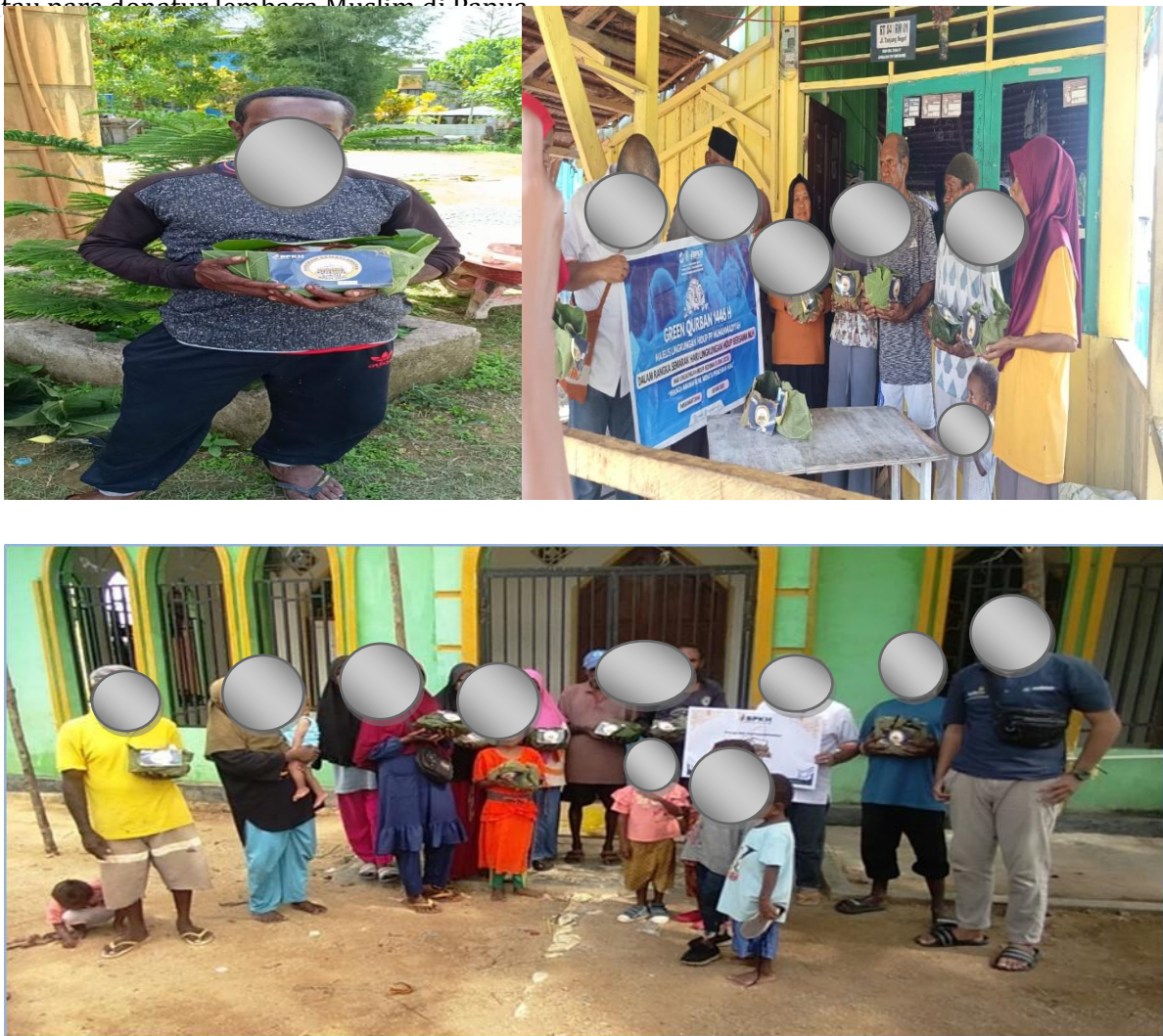
Gambar 5: Pensistribusian Hewan Qurban 1446 H/2025

Penyaluran daging qurban yang dilakukan oleh LAZISMU Kota Sorong berfokus pada masyarakat yang rentan terhadap kemiskinan khususnya pada masyarakat Kokoda yang ada di Kota Sorong dan Kabupaten Sorong (Aimas) walaupun tidak semua daerah dapat di jangkau. Pemilihan lokasi ini dilihat dari karakteristik kerentanan ekonomi, sosial dan mayoritas suku Muslim Papua yang ada di Kota Sorong. Pendistribusian LAZISMU fokus di KM 8 Kelurahan Klasabi sebab suku Kokoda Muslim berada banyak di kelurahan tersebut. Tujuan utama adalah rumah kepala Suku Kokoda di KM 8 dengan tujuan untuk memudahkan pendistribusian tersebut, selain itu masyarakat yang tinggal dekat masjid sekitar juga diberikan. Dari hasil yang kami peroleh bahwa Kokoda Muslim di KM 8 tidak mendapatkan sapi qurban dari pemerintah tahun 2025 biasanya setiap tahun itu ada walaupun hanya satu ekor sapi diri Walikota Sorong atau para donatur lembaga Muslim di Papua.