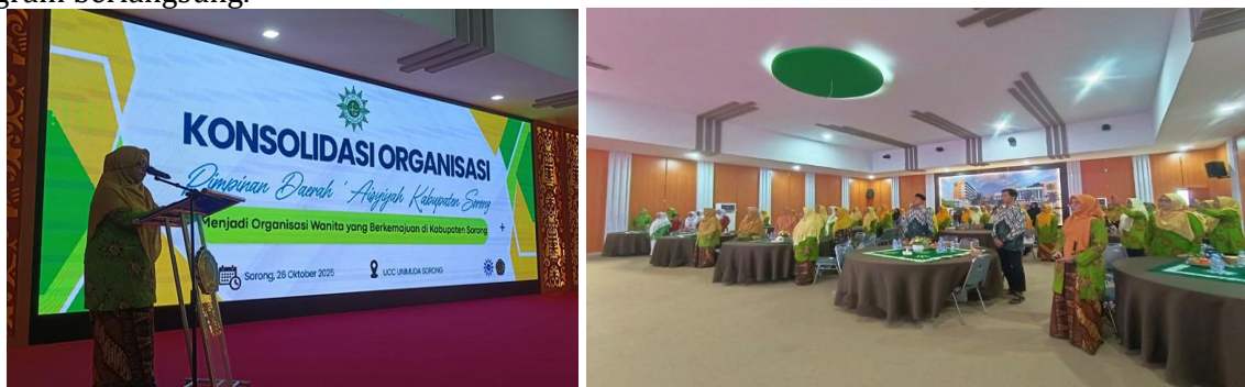
Gambar 1. Forum Konsolidasi Organisasi

Selain peningkatan kapasitas individu, program ini juga berhasil memperkuat konsolidasi kelembagaan. Forum konsolidasi yang dibentuk selama kegiatan menjadi media efektif bagi kader untuk berdiskusi, menyelaraskan program, serta membangun jejaring kolaboratif. Menurut Ilham dan Kurniawan (2021), keberadaan ruang koordinasi formal dapat mempercepat proses konsolidasi dan meningkatkan efektivitas pengambilan keputusan di organisasi lokal. Hal ini terlihat dari meningkatnya frekuensi komunikasi antara pimpinan cabang dan wilayah setelah program berlangsung.