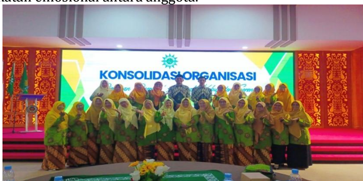
Gambar 2. Peserta Kegiatan Konsolidasi Organisasi

Dalam konteks sosial budaya Papua Barat Daya, pendekatan yang menghargai nilai lokal juga memberikan dampak positif. Kader Aisyiyah yang terlibat menyatakan bahwa penggunaan bahasa lokal dalam pelatihan dan pendekatan komunikatif yang santai membuat peserta lebih mudah memahami materi. Temuan tersebut sejalan dengan pandangan Wonda (2019) bahwa pemberdayaan perempuan Papua harus mempertimbangkan karakteristik budaya agar program lebih diterima oleh masyarakat. Pendekatan budaya ini turut memperkuat konsolidasi karena meningkatkan kedekatan emosional antara anggota.