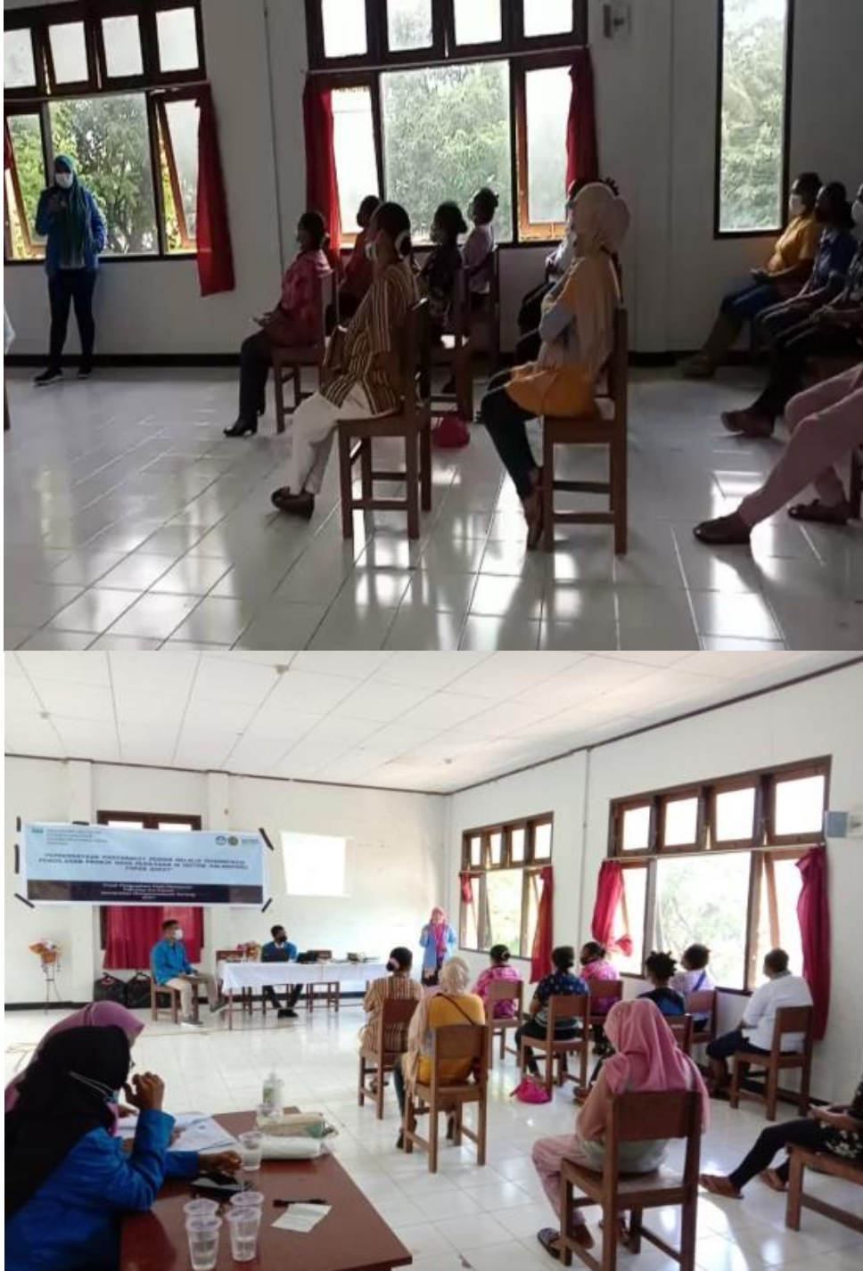
Gambar 1. Penyuluhan Pendidikan, dan pelatihan Manajemen Sumber Daya manusia

(Gambar 1), dilakukan juga kegiatan monitoring dan evaluasi melalui pre tes dan post-test, hasil analisis data menunjukkan bahwa dari 17 orang peserta, menunjukkan adanya peningkatan pengetahuan tentang pendidikan dan pelatihan manajemen sumber daya manusia, dari data tersebut secara keseluruhan menunjukkan nilai peningkatan sebesar 44% (Gambar 2).