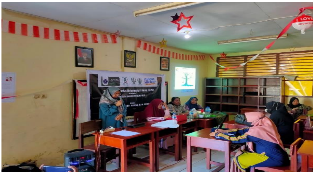
Gambar 1. Mengenalkan google dan google drive kepada ibu-ibu Ukm kampung makassar

Adapun langkah pertama dalam PKM ini mengenalkan apa itu google dan google drive . Google adalah sebuah perusahaan teknologi informasi yang berfokus pada jasa dan produk Internet. Produk tersebut meliputi teknologi pencarian, komputasi web, perangkat lunak, dan periklanan daring ( online ). Sedangkan google drive adalah Layanan daring ( online ) milik Google yang dapat digunakan untuk membuat, membagi ( share ), mengkolaborasi dan menyimpan data dengan kapasitas maksimal sebesar 5 GB ( free ).