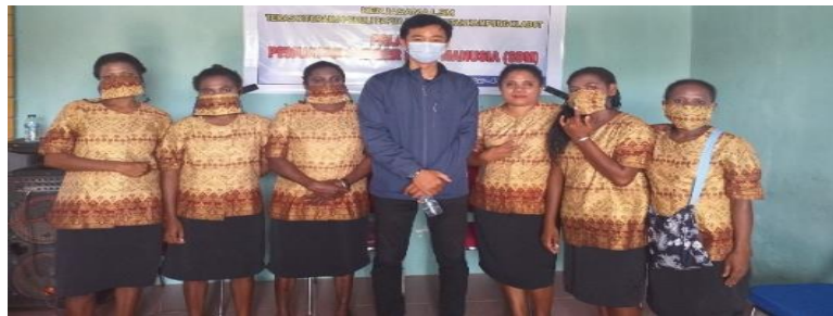
Gambar 5. Hasil Jahitan Baju, Rok dan Masker Para Peserta

Analisa hasil respon peserta pelatihan menjahit di tunjukkan pada tabel 1. Berdasarkan tabel tersebut didapatkan bahwa mayoritas peserta merasa puas dengan adanya pelatihan tersebut. Kepuasan peserta paling tinggi berkaitan dengan kejelasan materi dan kesesuaian materi dengan tujuan pelatihan. Hampir seluruh peserta memberikan skor kepuasan antara tiga dan empat. Hal ini mengindikasikan bahwa pelatihan menjahit sangat diterima baik oleh para peserta pelatihan masyarakat kampung Klabot.