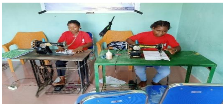
Gambar 3. Peserta dalam melakukan praktek langsung menjahit

Kegiatan Pelatihan menjahit dilaksanakan di Balai Desa Klabot. Kegiatan ini berlangsung selama 1 hari pada tanggal 17 April 2021. Materi kegiatan dilakukan dengan pengenalan alat-alat menjahit dan mesin jahit serta membuat pola dasar seperti pola rok dan pola baju serta menjahit masker, rok dan baju.