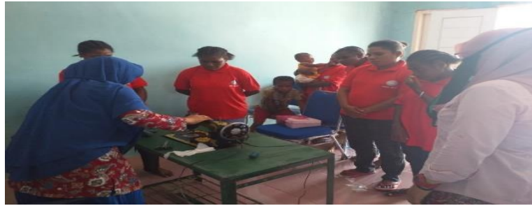
Gambar 4. Tim Ahli Sedang memberikan Materi kepada peserta