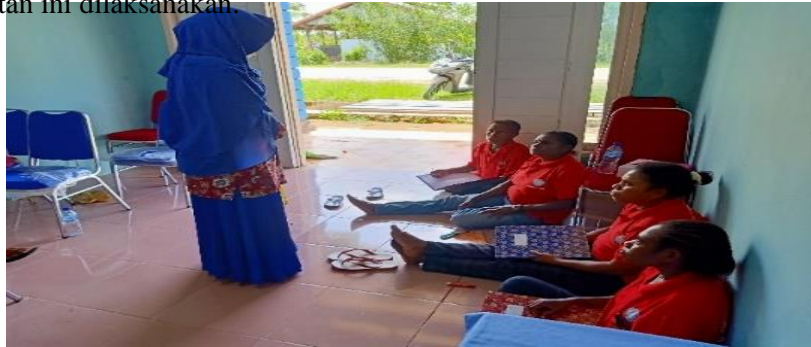
Gambar 2. Sosialisasi Program kepada peserta

kampung Klabot. Kegiatan sosialisasi ini juga dihadiri oleh aparat desa klabot, pada kesempatan ini dihadiri oleh Kepala Desa. Pada sosialisasi program didesa Klabot, kepala desa klabot sangat berharap kegiatan ini dilaksanakan.