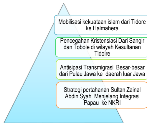
Gambar I. Nalar Politik Kesultanan Dalam Kebijakan Transmigrasi Lokal di Halmahera

Pandangan kritis seperti Michel Foucault tentang biokekuasaan yang menasar pada mekanisme dau kutup politik yakni anatomi politik tubuh manusia yang berfokus pada pendisiplinan dan optimalisasi subjek individu; dan bio politik populasi yang berkaitan dengan tubuh sepsis dan proses biologi skala besar. Zerilli, (2026) dalam pendekatan ini menilia bahwa proses trasnmigrasi yang dilakukan oleh Kesultanan Tidore bagian dari pada mobilisasi orang Tidore ke Halmahera dan Politik Tubuh dalam memperkuat benteng kekuatan Islam dan basis strategis untuk perebutan Irian Barat. Ingatan relasi sejarah dihidupan untuk kepentingan kebijakan tranmigrasi melalui jaringan wacana dan materi yang tersebar luas.