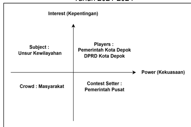
Gambar II. Analisis Stakeholder dalam Proses Pengintegrasian Program Bantuan Sosial di Kota Depok Tahun 2021-2024