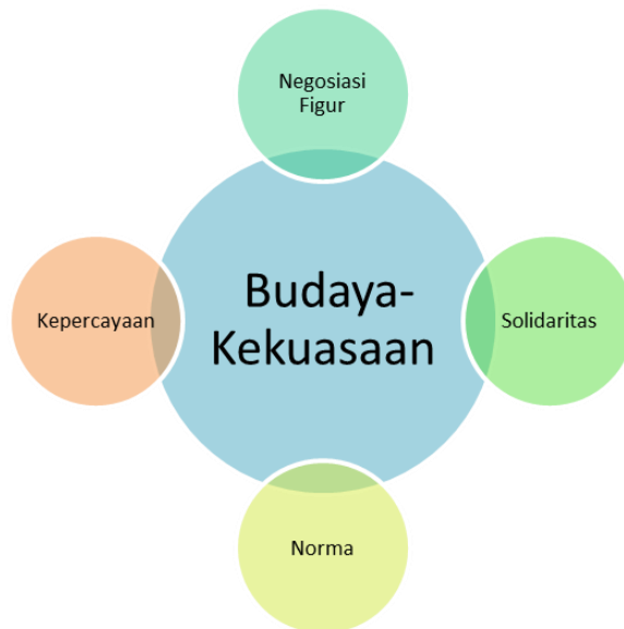
Gambar II. diskursus Budaya dan kekuasaan dalam Arena Demokrasi