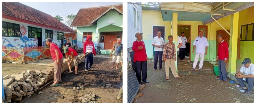
Gambar II: Proses Realisasi Pembangunan Gedung Sekolah TK