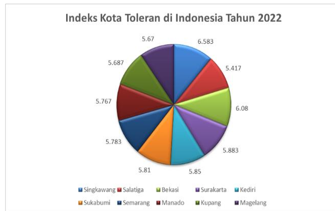
Gambar: III Indeks Kota Toleran di Indonesia