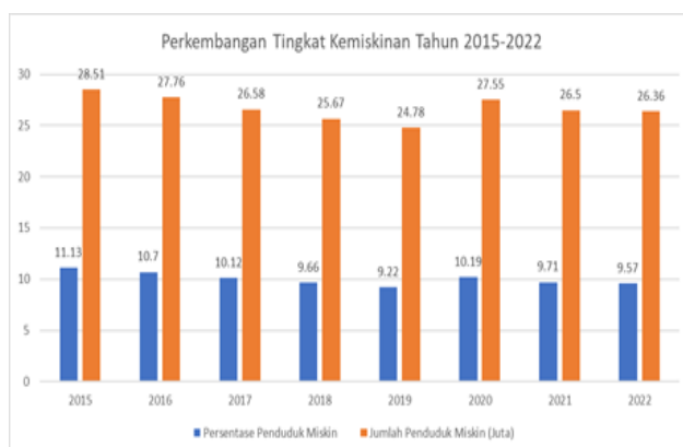
Gambar: I Perkembangan Tingkat Kemiskinan