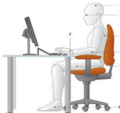
Gambar 2. Usulan Perbaikan

Alasan kedua adalah karyawan kurang memiliki kesadaran tentang penggunaan fasilitas kerja yang benar. Hal tersebut dapat diatasi dengan mensosialisasi tentang ergonomi kantor ( office ergonomics ) mengenai pentingnya memperhatikan ergonomic dalam bekerja dan resiko yang timbul jika melakukan postur kerja yang salah. Berikut adalah contoh untuk meminimalisir akan resiko terjadinya muskuloskeletal disorder bagi karyawan.