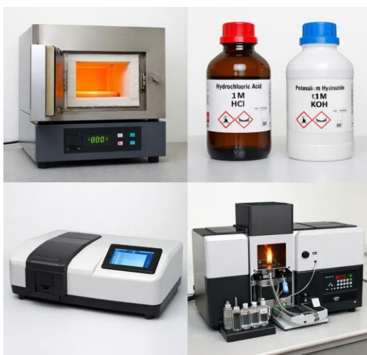
Gambar 1. Alat Karbonisasi (a), Bahan Aktivator (b), Alat Uji adsorpsi UV-VIS Spectrophotometer (c), dan alat analisis Logam Berat Atomic Absorption Spectroscopy (AAS) (d)