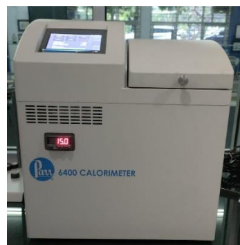
Gambar 2. Alat uji nilai kalor Parr-6400 Calorimeter

Uji nilai kalor dilakukan menggunakan Parr-6400 Calorimeter di Laboratorium Kimia Terapan Politeknik Negeri Malang. Sampel dikeringkan terlebih dahulu hingga kadar air konstan. Nilai kalor dinyatakan dalam satuan kalori per gram (kal/g), kemudian dikonversi menjadi megajoule per kilogram (MJ/kg). Pengujian dilakukan berdasarkan prinsip bom kalorimeter isoperibol dengan kontrol suhu otomatis sesuai standar ASTM D5865.