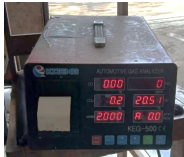
Gambar 3. KOENG KEG-500 Automotive Gas Analyzer

(%), CO (%), HC (ppm), dan Lambda ( \lambda ). Pengujian dilakukan pada kondisi bara api (non-flame combustion), yaitu saat nyala api padam dan hanya tersisa bara merah pada bio-kokas.