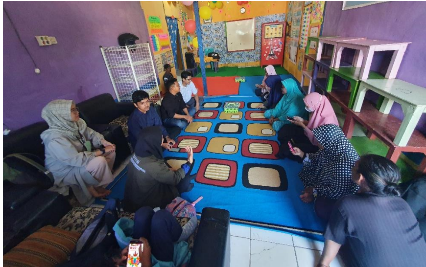
Gambar 4. Hasil wawancara awal bersama masyarakat setempat

Perubahan pandangan dari tidak mengetahui menjadi mengetahui tentang suatu informasi dapat dibuat contoh dalam bentuk tabel dibawah ini.