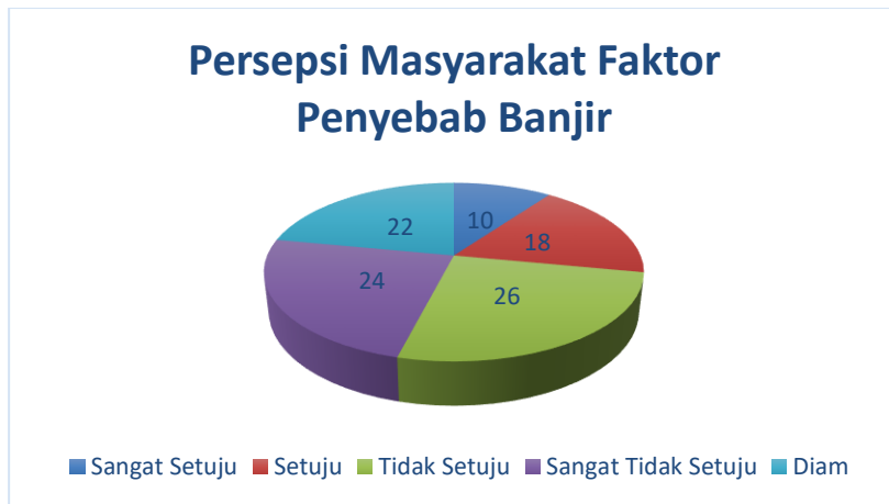
Gambar 1. Persepsi masyarakat penyebab banjir

Sehingga di harapkan upaya pemerintah dalam menggerakkan dengan cara menutup galian C dengan mulai melakukan reboisasi atau penghijauan dan mengembalikan kualitas sungai sehingga sungai dapat menampung air hujan sehingga mengurangi adanya bencana banjir, untuk itu dalam kegiatan sosialisasi ini kami menyebarkan kuisioner tanggapan masyarakat upaya pemerintah yang dilakukan hingga saat ini, dan jawaban responden pun sangat beragam dapat dilihat pada tabel di bawah ini